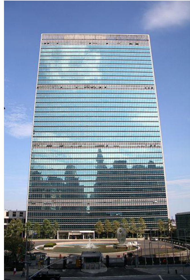
Штаб-квартира ООН в Нью-Йорке

Это уникальное международное сообщество, имеющее целью способствовать поддержанию и укреплению мира, экономическому и социальному прогрессу всех стран и народов.