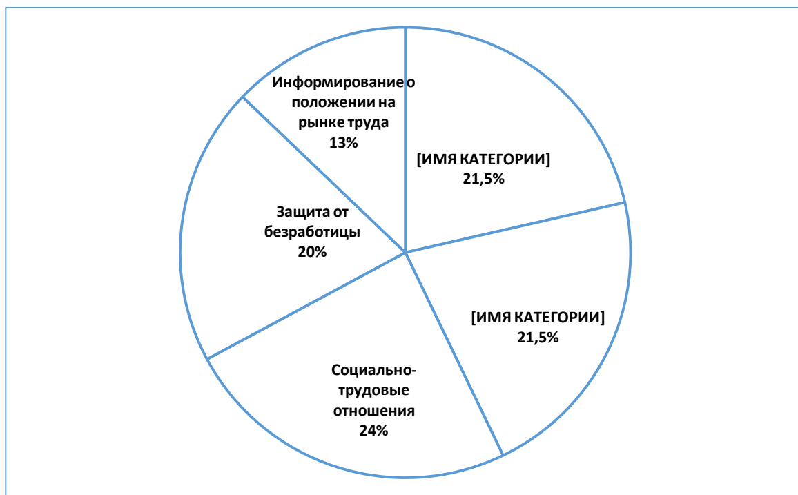
Рис. 2. - Направление проблемы, освещаемой в бюллетене (Критерии)

Семь публикаций носят аналитический характер, 64 - информационный характер. Сорок публикаций являются актуальными для молодежи и школьников, 17 - для социальной незащищённых граждан, 27 - для безработных граждан, 4 - для пенсионеров, 28 - для работодателей, 17 - представляют интерес для работающего населения, 2 - для администрации университетов, 13 - для муниципальных органов власти, 10 - для профсоюзных организаций, 2 - для мигрантов, 2 - для женщин, находящихся в отпуске по уходу за ребенком.