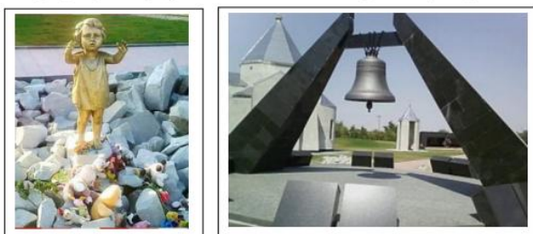
Мемориал детям концлагеря «Красный»

30 апреля 1945 года старший сержант Николай Масалов , рискуя своей жизнью, вынес из-под огня немецкую девочку. Это событие стало сюжетом памятника Воину-освободителю в Берлине . История произошла в самом конце войны в Тиргартене — одном из центральных районов германской столицы, во время боёв за взятие Берлина. Солдаты 79-й гвардейской стрелковой дивизии под началом Василия Чуйкова обнаружили вражеские войска, которые защищали бункер Гитлера . Незадолго до решающей атаки воцарилась тишина. И вдруг в этой тишине прозвучали крики маленькой девочки, которая звала маму. Их услышал Николай Масалов и бросился на помощь. Укрываясь от осколков и пуль, он дополз до ребёнка, взял на руки и понёс. Девочка начала кричать ещё громче, тогда, чтобы крик ребёнка не выдал его немецким солдатам, он попросил своих прикрыть его, и советские воины ответили шквальным огнём. Под прикрытием этого огня сержант Масалов невредимым добрался до своих и передал спасённого ребенка в штаб полка.