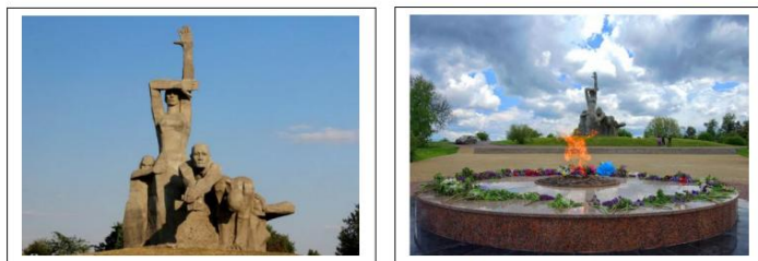
Мемориал жертвам фашизма «Змиёвская балка»