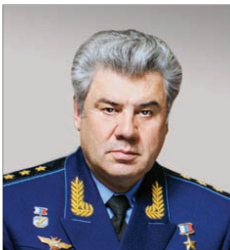
Виктор Николаевич Бондарев

главнокомандующий военно-воздушными силами, ГЕНЕРАЛ-ПОЛКОВНИК