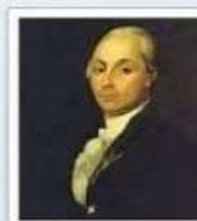
А. Н. Радищев

Существенный недостаток: идеалистичность.