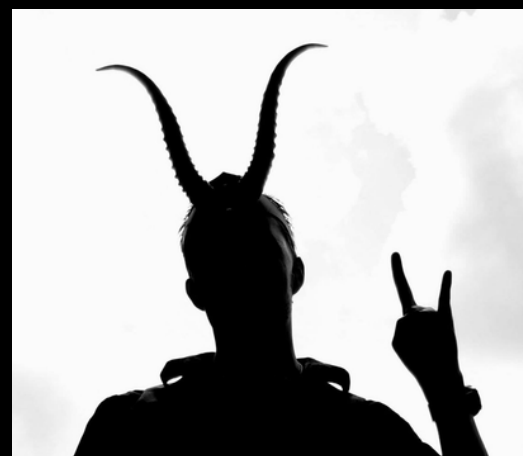
сект и религиозных радикалов