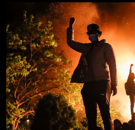
радикалов и экстремистов