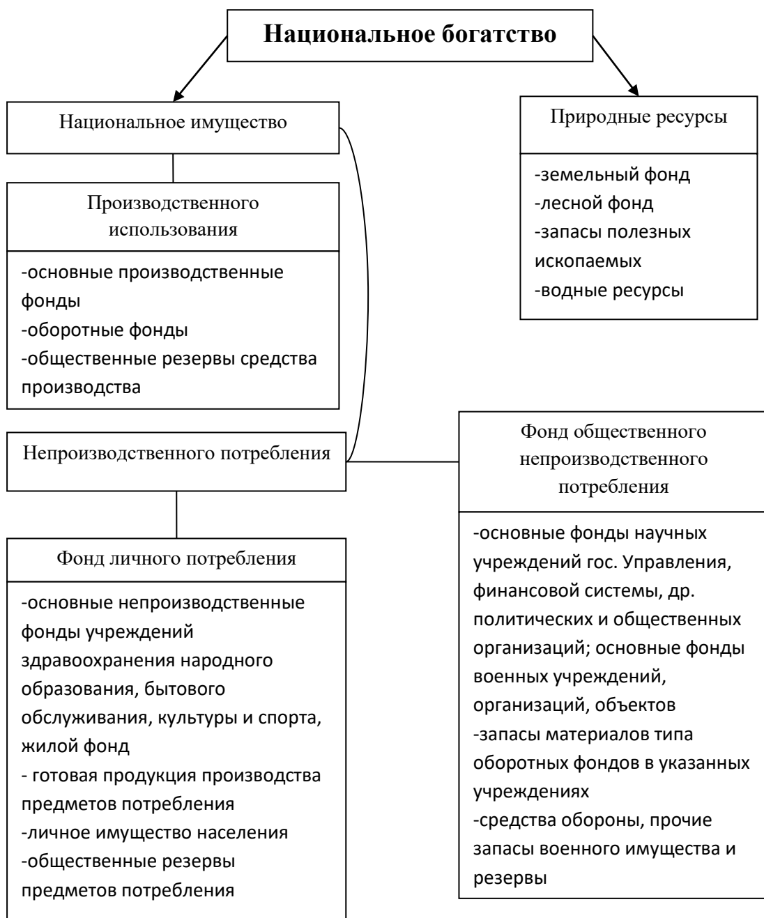
Натурально-вещественное строение национального богатства