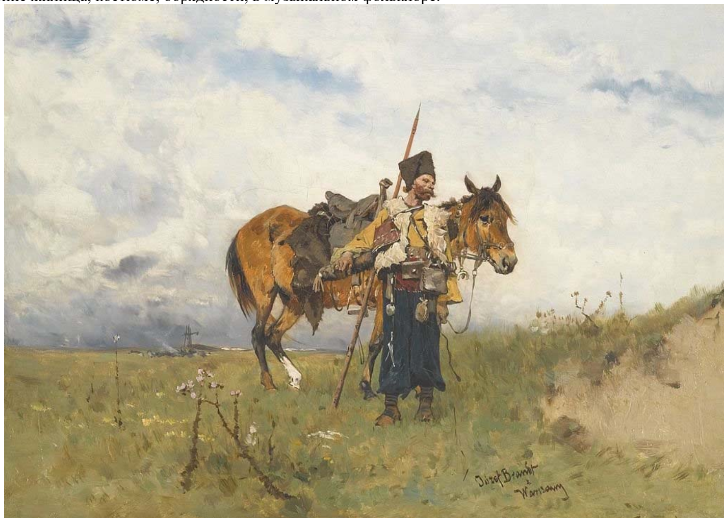
Казак в изображении художника Юзефа Бранта

Как известно, на начало XX века в России насчитывалось одиннадцать казачьих войск: донское, уральское, кубанское, терское, астраханское, оренбургское, сибирское, забайкальское, семиреченское, алтайское, амурское, уссурийское. Находясь в различных географических условиях, в каждой казачьей общности сформировались свои специфические черты, которые, помимо несения службы, заключаются во многих аспектах жизни, например, в особенностях ведения хозяйства, промыслах, типе жилища, costume, обрядности, в музыкальном фольклоре.