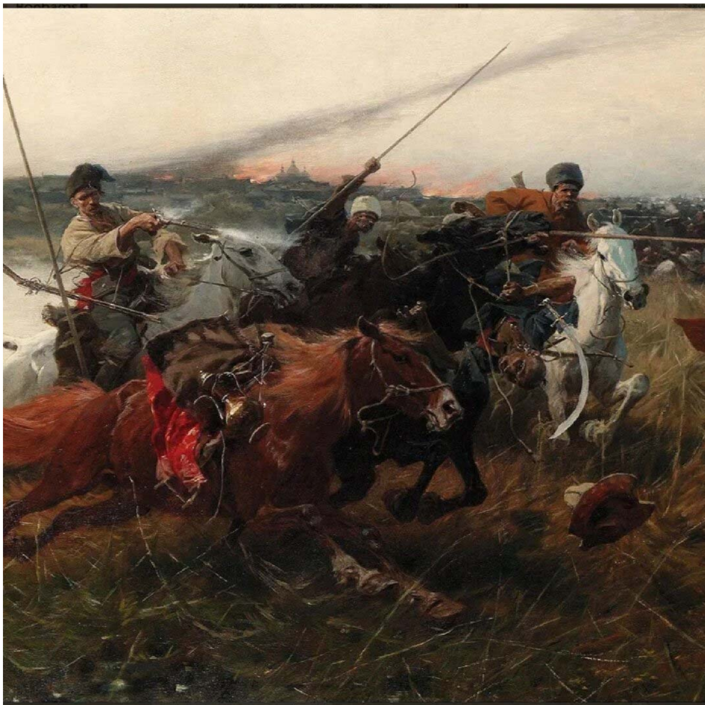
Казаки в изображении художника Юзефа Бранта

Казачество – это и общепризнанное высокоорганизованное военно-патриотическое сословие, благодаря которому исторически осуществлялась надежная защита границ государства. Военскую культуру российского казачества можно охарактеризовать как традиционную культуру воина – патриота, защитника веры, Отечества, национального и культурного достоинства. Категория «казачество» объединяет всех казаков в единый, целостный организм. Духовная направленность, патриотизм, свободолюбие, способность к самоорганизации, высокая хозяйственная культура и социальное служение должны найти достойное применение в созидательных преобразованиях российского общества.