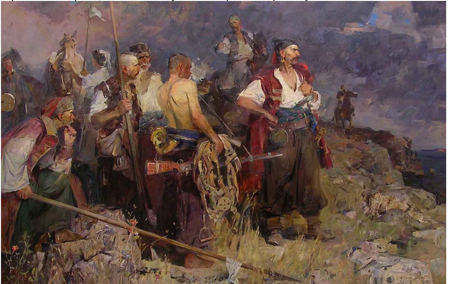
Запорожские казаки в картине Сергея Коваленко

Арабский географ Масуди, посетивший в X веке Приазовский Край, пишет: «между большими и известными реками, впадающими в море Понтус (Чёрное), находится одна, называемая Танаис (Дон) , которая приходит с севера. Берега её обитаемы многочисленным народом славянским и другими народами. Таким образом, сильный и воинственный славянский народ Русь заселял с давних времён территорию современных Казачьих Земель и, с середины VII века, входил в состав Хазарской Империи. В дальнейшем - с IX столетия, под натиском новых азиатских завоевателей, венгров, торков и печенегов , начался распад Хазарской Империи и отделение её окраин: Поднепровья - впоследствии Киевское государство, и Среднего Поволжья — Камской Болгарии. Русы же Подонско - Приазовские ещё продолжали оставаться в составе Хазарской Империи. Камская Болгария (в среднем течении Волги и по Каме), находившаяся под влиянием арабской культуры , уже в первой половине IX ст. приняла ислам. Русь Подонско-Приазовская (Казакия) — аланы и казаки — примерно в то же время стала христианской ; следовательно, она стала христианской значительно раньше Руси Киевской (Крещение Руси великим князем Владимиром, как известно, состоялось в 988 году). О том, что Русь Подонско - Приазовская стала христианской раньше Руси Киевской, свидетельствует патриарх Фотий и Устав Византийского императора Льва Философа (836 — 911) о чине митрополичьих церквей, где на 61 месте указана построенная церковь Русская.