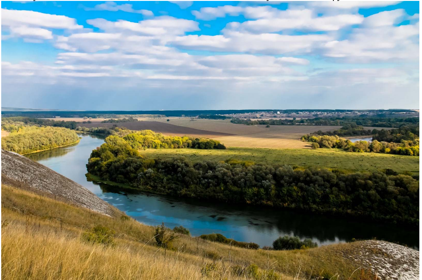
Река Дон – территория исторического расселения казачества

побежденных могла спастись. Выжить в таких условиях могли самые сильные, выносливые и свободолюбивые. Благодаря такому «естественному» отбору в процессе историко-культурной эволюции образовались древнейшие корни казачества. Целесообразно рассмотреть и теорию, не основанную на положении о том, что казачество является частью субэтнуса великорусского этноса.