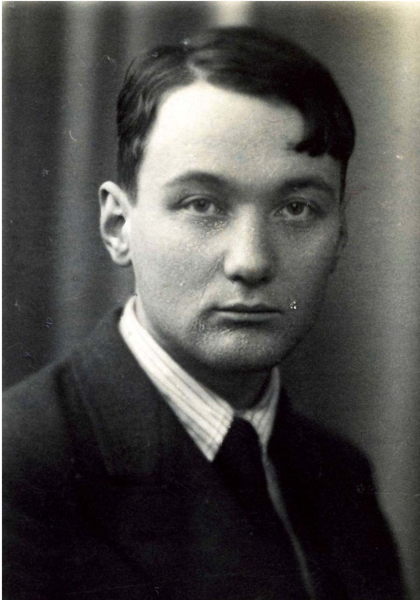
Лев Николаевич Гумилев

качестве «таксономической единицы внутри этноса как зримого целого, не нарушающего его единства». Иными словами – это общность, обладающая характеристиками народа, но при этом прочно связанная с основным этносом.