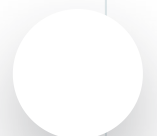
Схема по созданию закрытых петель