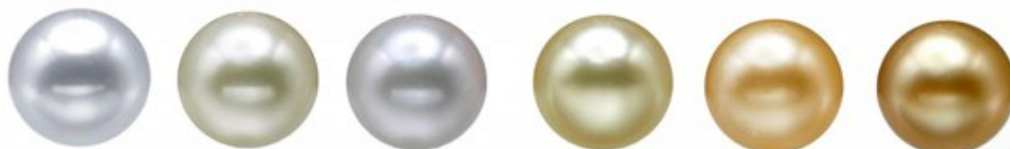
рис. Цвет южного жемчуга в зависимости от окраски раковины