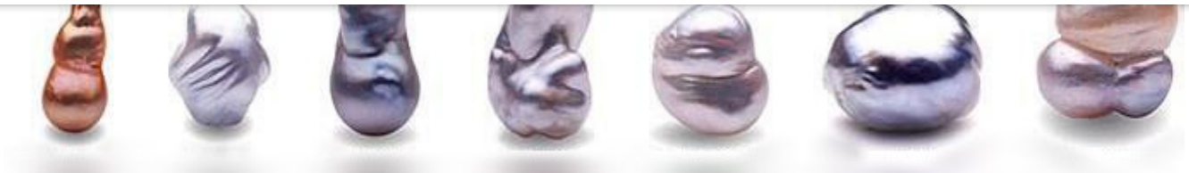
рис. Разнообразие природных форм жемчужин

Существует большое многообразие форм жемчуга, наиболее ценной из них является идеальная сферическая форма.