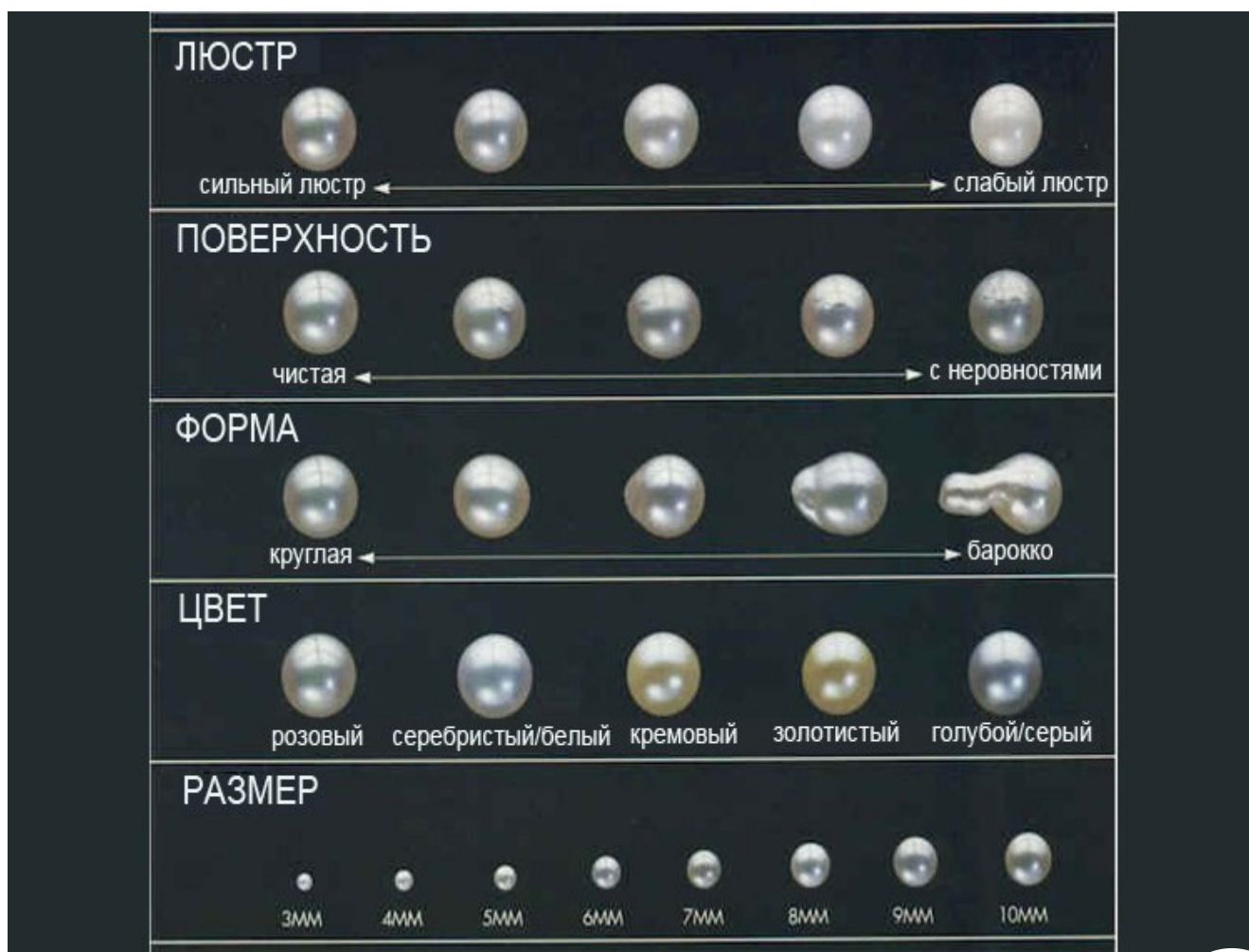
рис. Вариативность жемчуга

Также жемчуг может отличаться по люстр, размеру, форме, цвету и поверхности жемчужин.