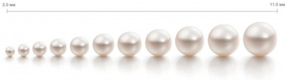
рис. размеры жемчуга Акойя

Эта культивированная жемчужина выращивается в китайских и японских водах (в основном, в Южной Японии). Жемчужины Акойя круглые, по цвету природные оттенки этого вида жемчуга могут быть теплыми и холодными от голубого, кремового до нежно-розового. Размер жемчужин различается от 2 до 11 мм. Самый известный бренд, продающий данный жемчуг — Микимото и как правило этот жемчуг используется в ювелирном деле, т.к. жемчуг Акойя обладает премиальной ценой (что обусловлено низким уровнем выживания устриц Акойя и сложностью культивирования).