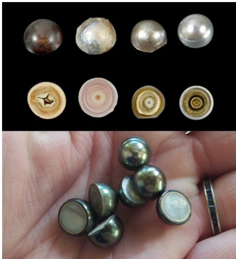
рис. Природный (сверху) и культивированный (снизу) жемчуг в разрезе

В природном диком жемчуге раздражитель обычно попадает из воды, в то время как в культивированном жемчуге люди закладывают затравку (ядро) внутрь, чтобы начать процесс.