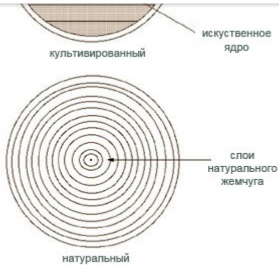
рис. Схема натурального и культивированного жемчуга в разрезе

В природном диком жемчуге раздражитель обычно попадает из воды, в то время как в культивированном жемчуге люди закладывают затравку (ядро) внутрь, чтобы начать процесс.