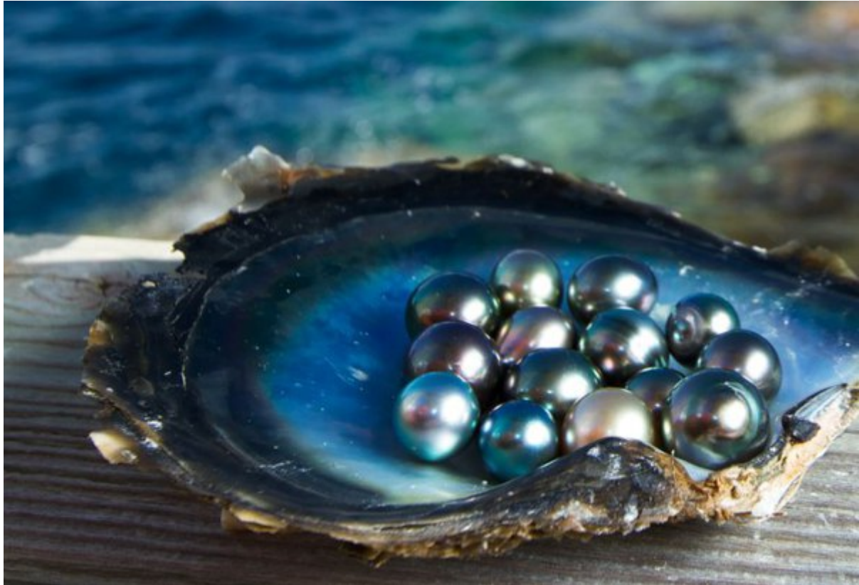
рис. Разнообразие цветов и чернотубая устрица