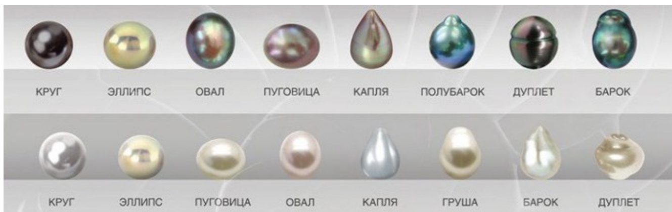
рис. Традиционные русскоязычные названия форм жемчуга

Существует большое многообразие форм жемчуга, наиболее ценной из них является идеальная сферическая форма.