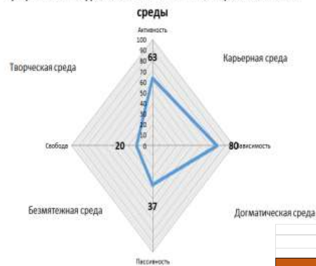
Графическая модель соотношения типов образовательной среды

Исследуемая среда отнесена к «карьерной среде», способствующей развитию активности, но и зависимости ребенка. В такой среде воспитывается лицемерный, честолюбивый тип личности. Поэтому, считаем необходимым разработать систему мероприятий по формированию в Учреждении творческой образовательной среды, способствующей развитию нормального (идеального) типа личности и повысить такие показатели как осознаваемость, обобщенность, когерентность, доминантность, эмоциональность, интенсивность, широта.