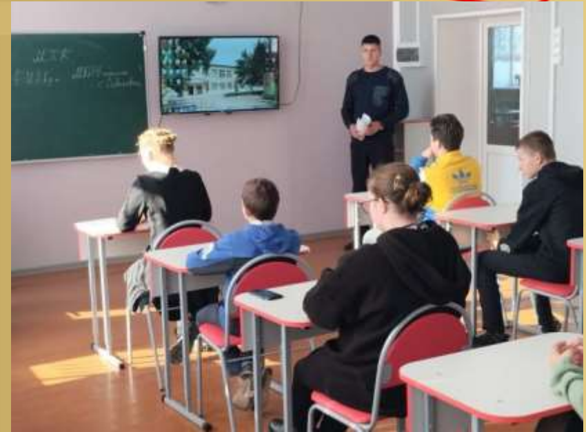
Беседа с инспектором ГИБДД Хорольского округа