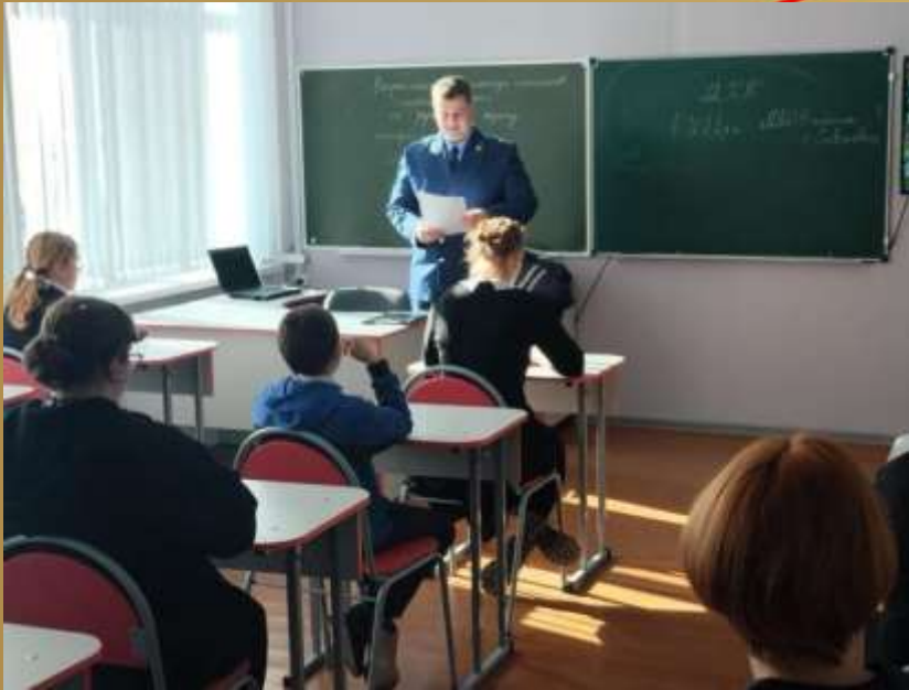
Встреча с прокурором Хорольского округа