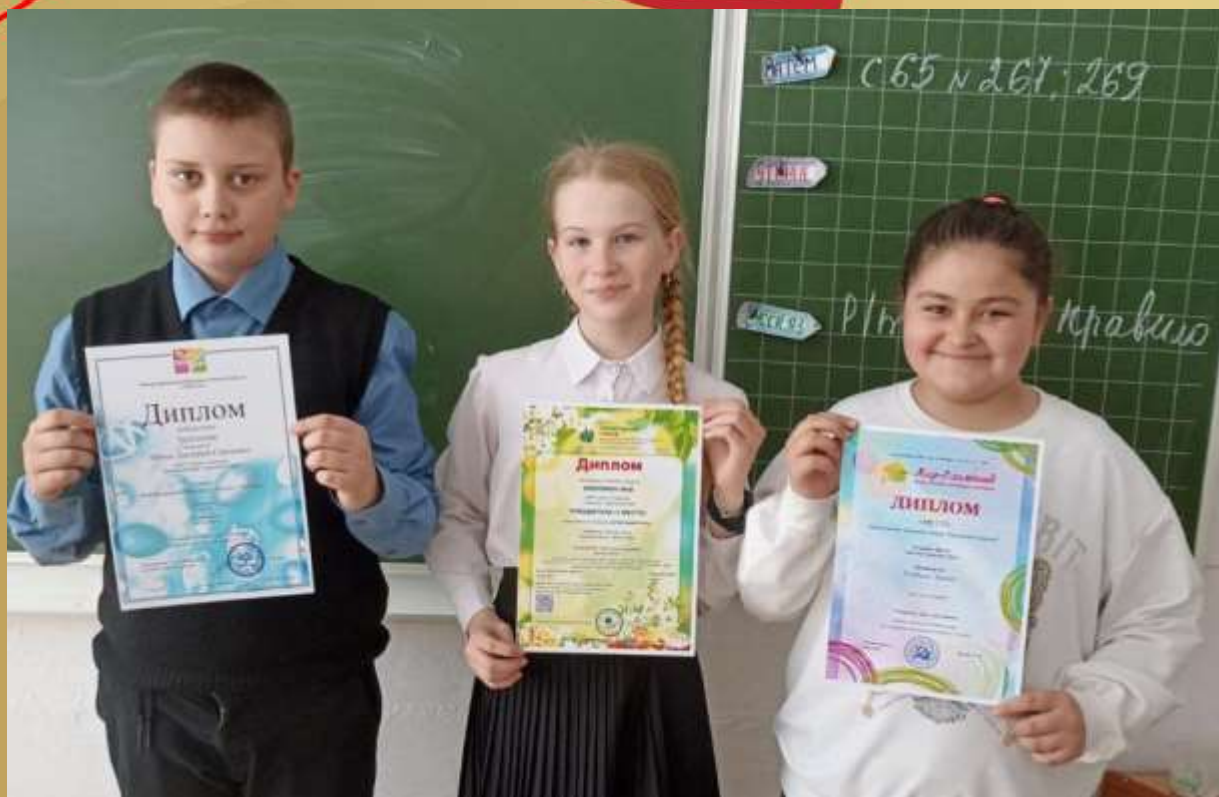
Всероссийский конкурс «Светлый праздник – Святая Пасха