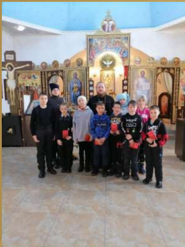
Экскурсия в с.Хороль в храм Рождества Пресвятой Богородицы