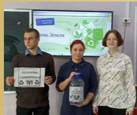
участие в конкурсе «Экология России»