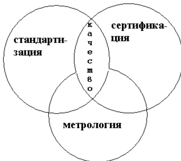
Рис.1. Триада методов и видов деятельности по обеспечению качества

Большое значение для регулирования механизмов рыночной экономики приобрела сертификация. Для многих видов продукции и процессов она стала обязательной. Сертификация рассматривается как официальное подтверждение соответствия стандартам и во многом определяет конкурентоспособность продукции. На лекциях по сертификации рассматриваются средства и методы проведения работ по различным видам сертификации. В последние годы к традиционно широко практикуемой сертификации продукции добавились сертификация услуг в торговле, туризме, бытовом обслуживании и даже в сфере образования. Активно развивается сертификация систем качества и экологического управления предприятий на соответствие стандартам серии ИСО 9000 и ИСО 14000, а также сертификация персонала.