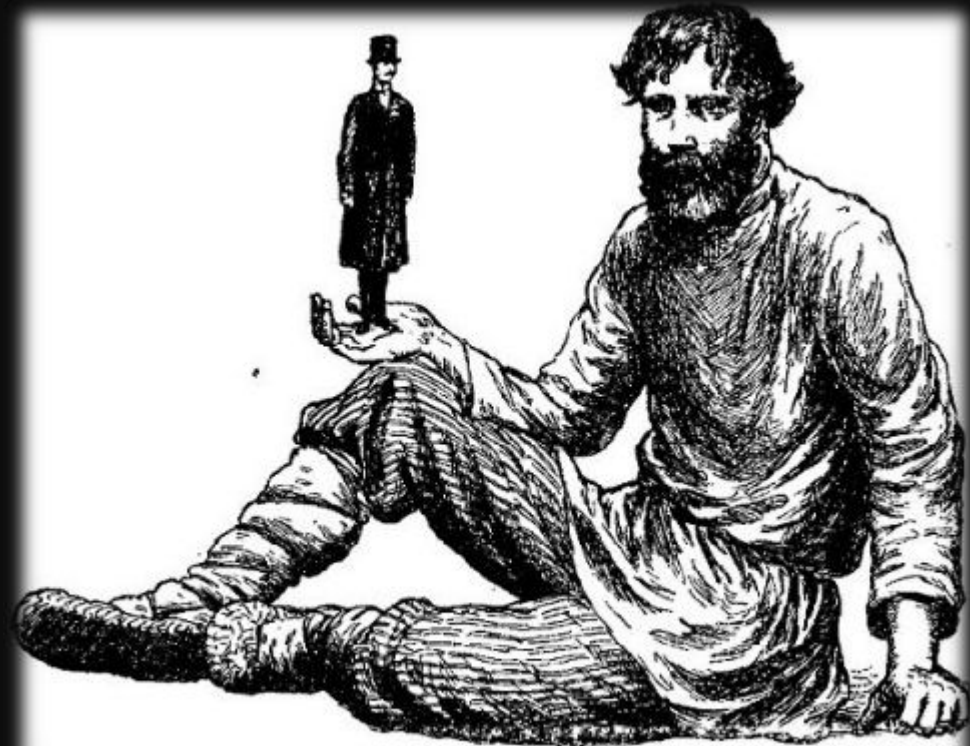
Сравнительная численность крестьянства и служилого сословия.