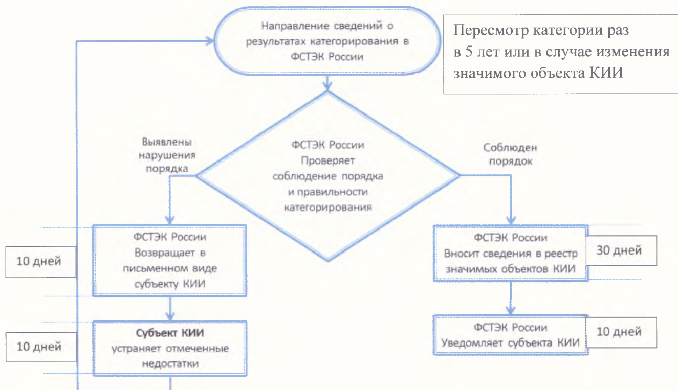
Рисунок 3. Схема рассмотрения результатов категорирования

Рассмотрение результатов категорирования производится в соответствии со схемой, представленной на рис. 3.