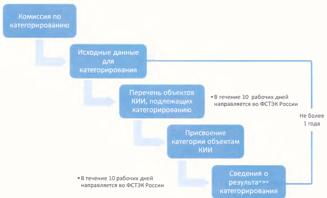
Рисунок 1. Общая схема категорирования

Общая схема работ по категорированию объектов ТЭК в соответствии со ст. 7 Федерального закона № 187-ФЗ представлена на рис. 1.