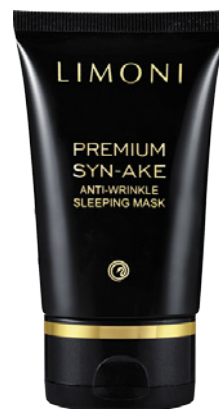
PREMIUM SYN-AKE ANTI-WRINKLE SLEEPING MASK

Антивозрастная ночная маска для лица со змеиным ядом