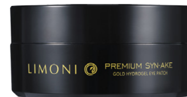
PREMIUM SYN-AKE GOLD HYDROGEL EYE PATCH

Антивозрастные гелевые патчи для век со змеиным ядом