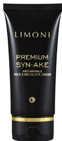
PREMIUM SYN-AKE NECK & DECOLLETE CREAM

Антивозрастной крем для шеи и декольте со змеиным ядом