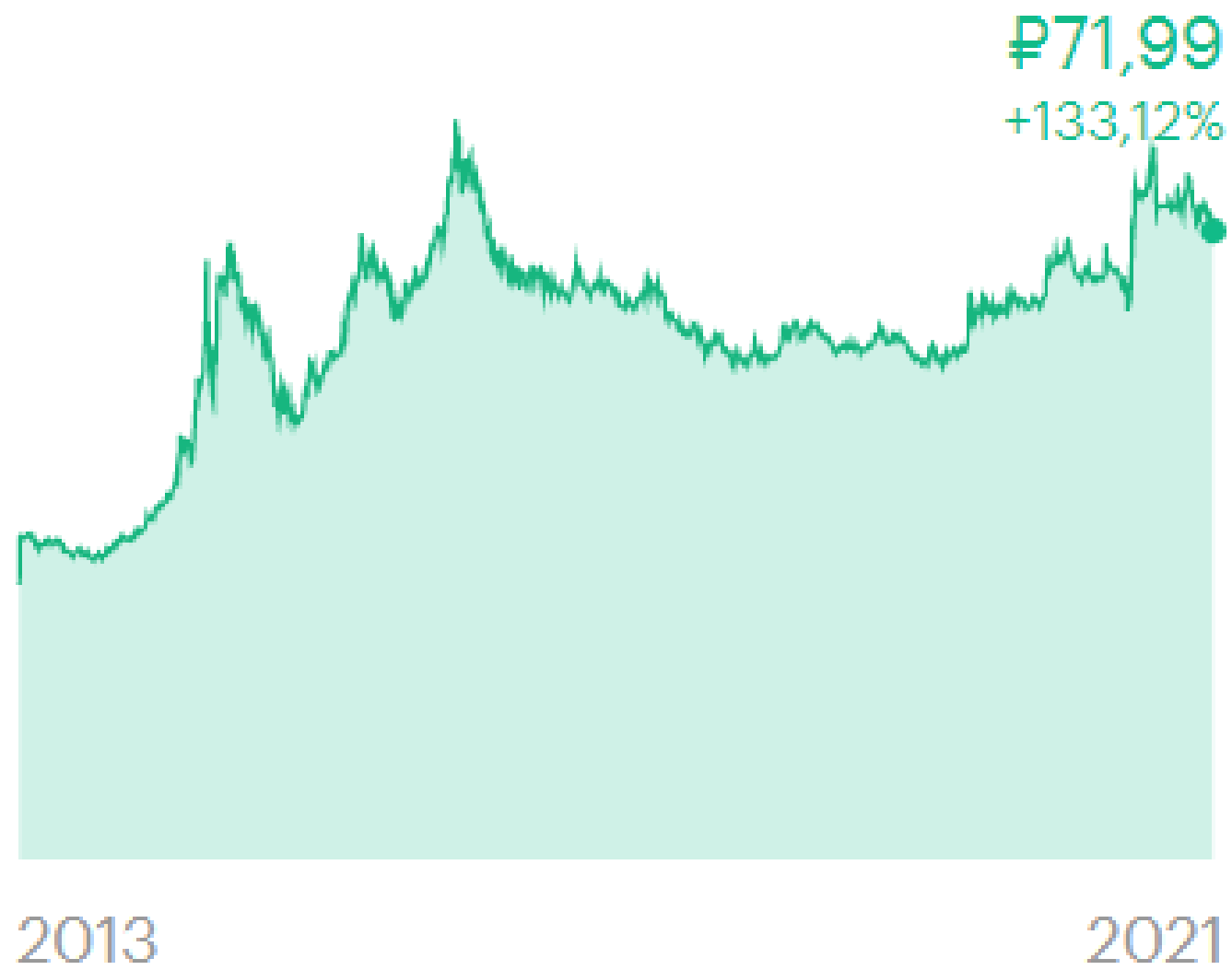
Курс валют, руб. $