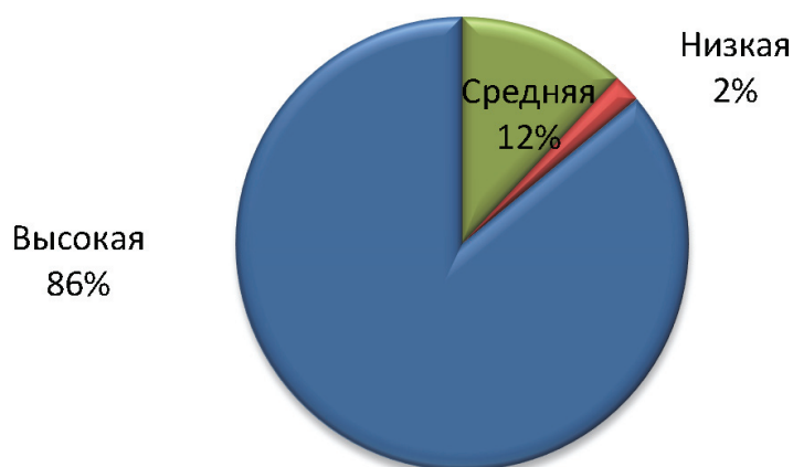
Рис. 2. Распределение поступивших прямых иностранных инвестиций по категориям регионов (данные платежного баланса РФ за первое полугодие 2017 года, согласно данным Банка России)

Вышесказанные слова подтверждают статистические данные по регионам РФ проведенные национальным рейтинговым агентством.