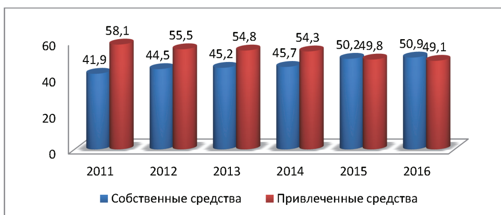
Рис. 4. Структура источников финансирования инвестиций, в % к итогу (по данным Росстата России)

Данные рис. 4 свидетельствуют о том, что собственные и привлеченные средства составляли практически одинаковую долю инвестиций в основной капитал в 2016 г. – 50,9% и 49,1% соответственно. Если еще в 2011 году использование инвестиционных вложений происходило в большей степени за счет привлеченных источников, то по итогам 2016 года ситуация изменилась и на первый план выходят собственные средства организаций. Сложившаяся ситуация говорит о том, что государству и дальше нужно поддерживать инвестиционную активность.