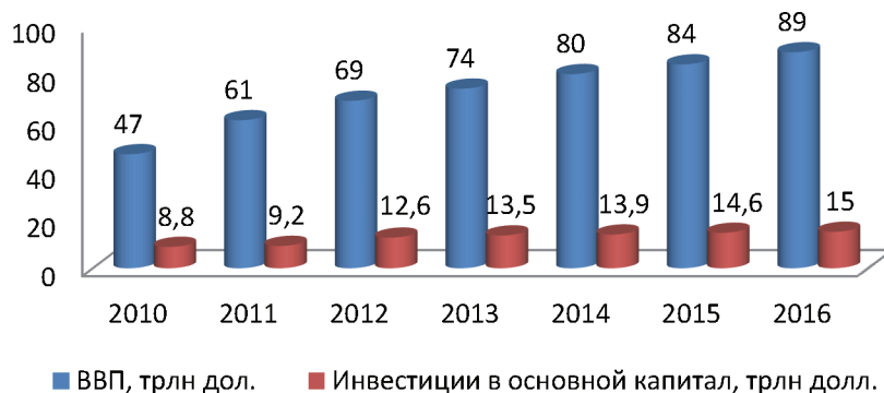
Рис. 1. ВВП и данные об инвестициях в основной капитал (по данным Росстата России)

По результатам, представленным на рис. 1 можно сделать вывод, что рост инвестиций в основной капитал за 2010–2016 гг. составил 202%, а рост ВВП 216% [6]. Получается, повышение инвестиционной активности привело к увеличению ВВП, который складывается в основном из результатов деятельности региональных хозяйственных систем страны. Но достигнутый темп роста инвестиций недостаточен для современной модернизации экономики страны, которой необходимы преобразования на качественном новом витке инновационных процессов.