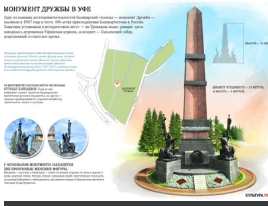
Фото и видео