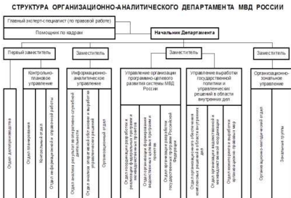
Рис.3. Структура Организационно-аналитического департамента МВД России.

Структура Департамента представлена на рисунке 3.