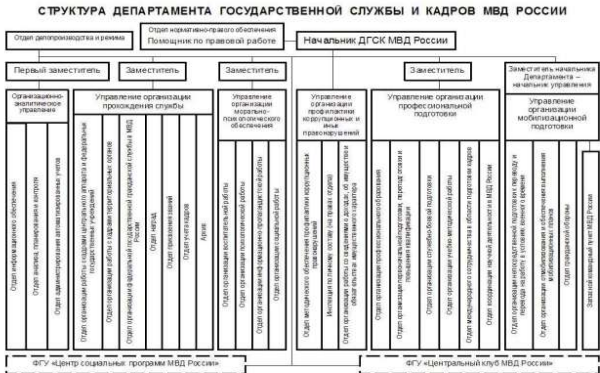
Рис. 4. Структура Департамента государственной службы и кадров МВД России.

коррупционных и иных правонарушений, Организационно-аналитическое управление. Департамент осуществляет непосредственное руководство деятельностью федерального казенного учреждения «Центральный клуб Министерства внутренних дел Российской Федерации», федерального казенного учреждения «Центр социальных программ Министерства внутренних дел Российской Федерации». Департамент в установленном порядке осуществляет взаимодействие по вопросам своей деятельности с подразделениями МВД России, кадровыми подразделениями правоохранительных органов, общественными объединениями и организациями. Структура Департамента представлена на рисунке 4.