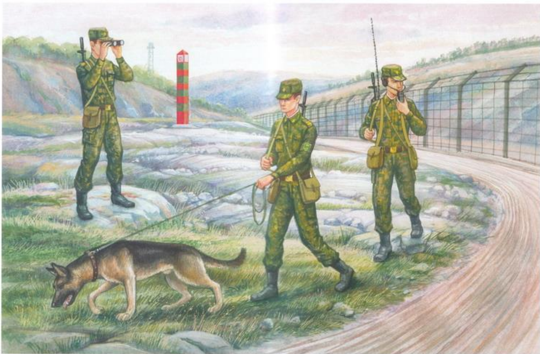
Художник В. М. Карамай