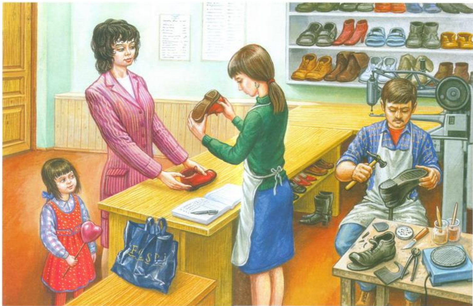
Художник В. М. Карамай