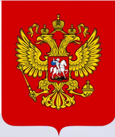
Изображение Российского герба