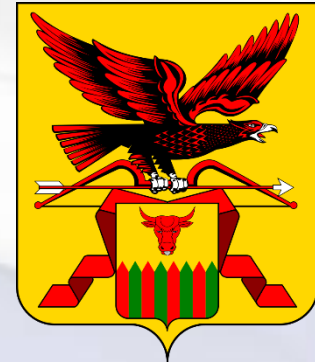
Изображение герба Забайкальского герба

При одновременном размещении Государственного герба Российской Федерации и герба (геральдического знака) субъекта Российской Федерации, ... Государственный герб Российской Федерации располагается с левой стороны от другого герба (геральдического знака), если стоять к ним лицом;